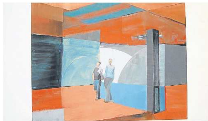
Durch Farbe und geometrische Formen entsteht in Anna-Maria Kursawes Werk Raum.