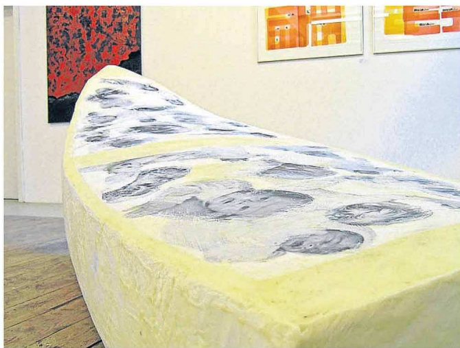
„Wanderung“ heißt die Styropor-Wachs-Skulptur von Edith Toth.

Poetisch-feinsinnige, emotionale und tiefgründige Werke sind in den Räumen der Kulturwerkstatt zu sehen. Hans Fuchs thematisiert die Ausbeutung der Natur durch