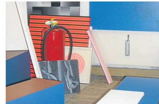
Ist das Kunst? Ob der Feuerlöscher Teil dieses Werks ist, oder zufällig im Raum steht, lassen die Künstler offen.

stellen: „Nehme ich das Objekt als Feuerlöscher wahr? Oder als rotes Gefäß mit einem schwarzen Streifen.“ Einige von seinen Werken sind bunt gestreifte Leinwände. Aus der Ferne sieht es so aus, als würden sich die Streifen verschieben, flimmern und lebendig sein. Trotzdem sind sie anti-illusionistisch. Denn es geht um das Bild an sich – als Eigenwert.