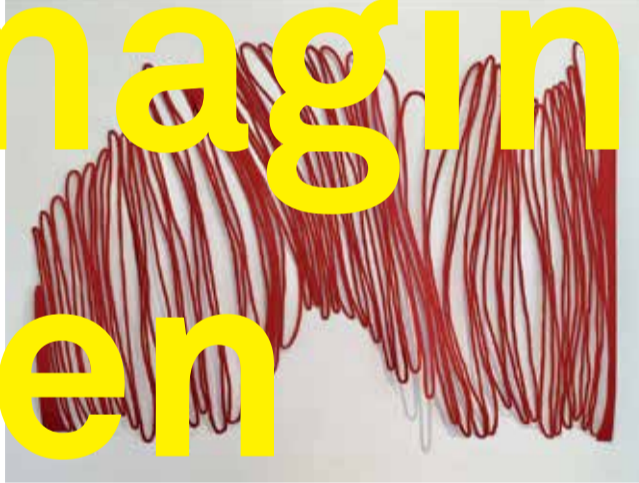
Kulturwerkstatt HAUS 10 Fürstenfeld 10 B 82256 Fürstenfeldbruck